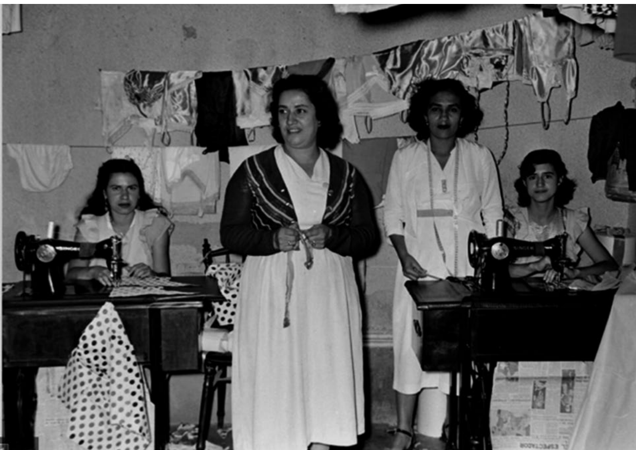
[Modistas de Medellín].

a las mujeres, a los relatos y a lo colectivo. Fueran cueros, telas u otras materias, unir con hilos permitió tener sacos y bolsos para cargar y almacenar, vestidos para arropar y, al mismo tiempo, momentos de conversación y encuentro. Por ello, es común que ante la pregunta de cómo aprendió a coser, las enseñanzas de madres, abuelas, tías, primas y amigas sean un elemento común, así como también el observar y experimentar, el trabajo empírico.