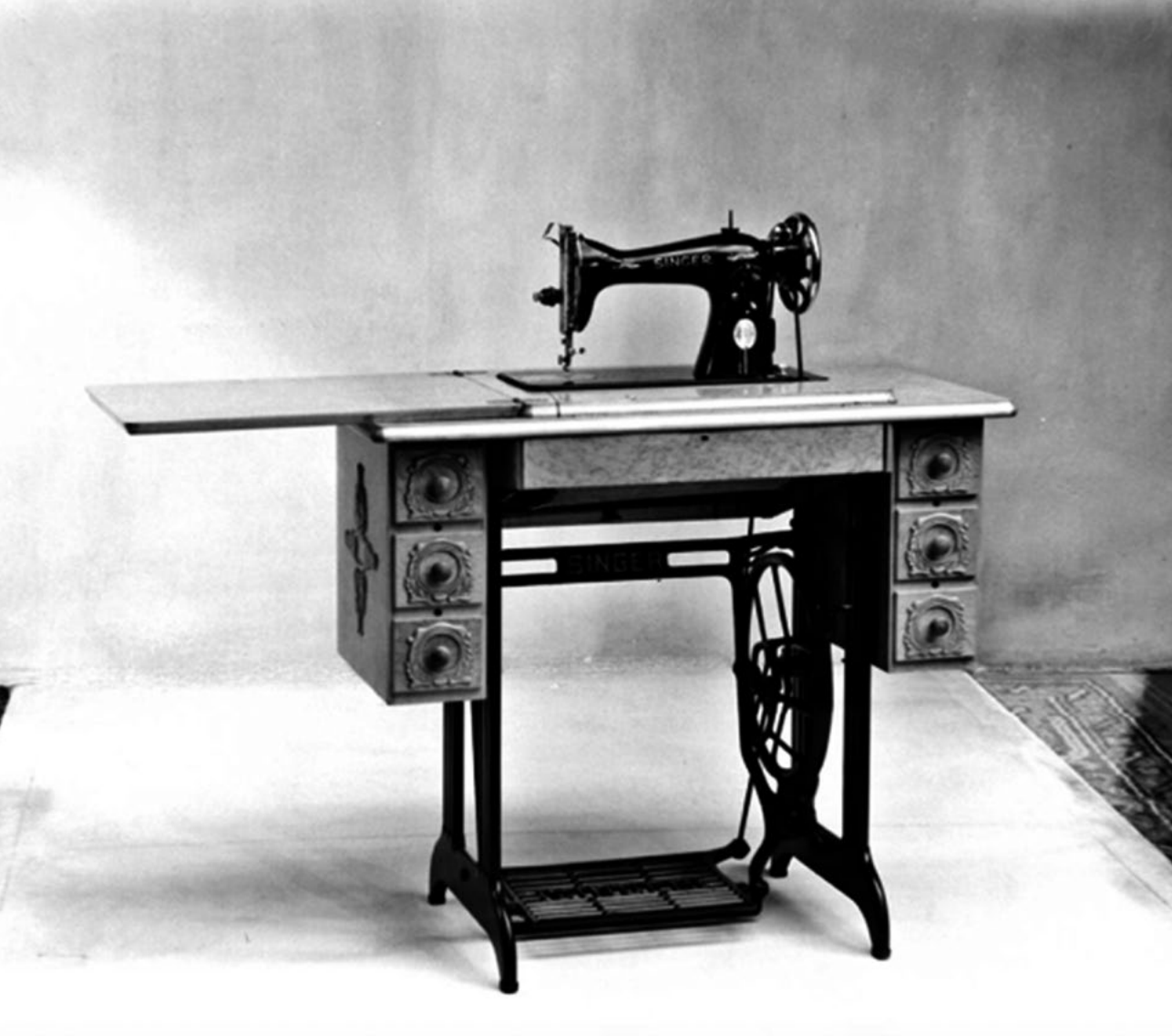
Máquina de coser.

Con esa máquina empezó a recibir pedidos para “enresortar” partes traseras de blusas, de una compañía que se llamaba Gemar. Durante mucho tiempo se dedicó a esta labor, y con lo que recibió por ese trabajo pudo conseguir una fileteadora con un motorcito grande, aunque “familiar”, es decir, hecha para uso doméstico más que para grandes volúmenes y ritmos industriales. Tampoco funcionaba muy bien, pero con lo obtenido con ese recurso pudo comprarse la máquina Plana.